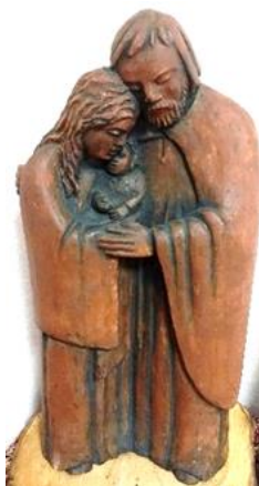
Plastik: Franz-Josef Urmelzer

Dieses Lied von Jochen Klepper kann uns in diesen Tagen, da wir durch Corona mehr auf uns zurückgeworfen werden, viel Kraft geben. Schauen wir auf Jesus Christus und finden wir in ihm und durch ihn die Kraft, seine Wege zu gehen.